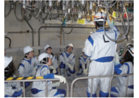
東電第二原発見学の様子

受講者からは「大学の講義では学べない知識を習得できた。」「講義や実習、フィールド訪問を通じて、学ぶこと以外に全国の学生と意見交換できて良かった。このような機会は滅多にないと思う。」「前半座学をし、そこで学んだことを実習で活かすことができ良かった。」「放射