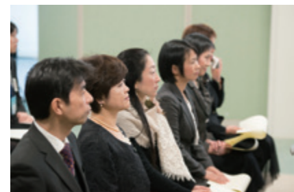
祝辞に聞き入る修了者