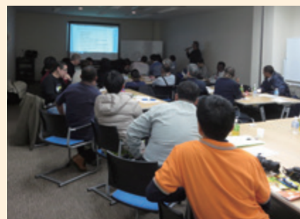
会議の様子 (於：静岡県御殿場市)

参加団体：ハンセン病回復者社会統合運動 MORHAN (ブラジル)、ハンセン病回復者協会 PerMaTa (インドネシア)、ハンセン病回復者協会 APAL (インド)、ハンセン病協会連盟 KFHA (韓国)、ハンセン病活動家連合 CLAP (フィリピン)、全国ハンセン病回復者協会 ENAPAL (エチオピア)、Care & Share Circle (マレーシア)、Joy in Action (中国)、保健省疾病対策局 (タイ)、IDEA USA (アメリカ)、駿河療養所自治会 (日本)、ハンセン病市民学会 (日本) 他