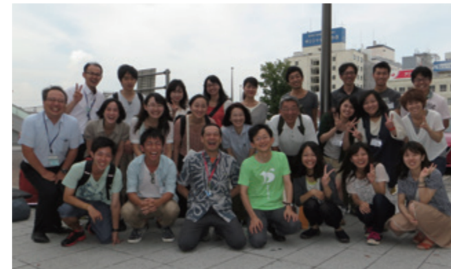
2014年度セミナーの受講者

線災害医療について、さまざまな観点から総合的に学べて良かった。」などの感想が寄せられています。