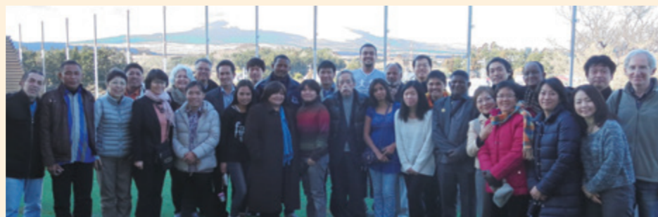
富士山のふもとでの集合写真