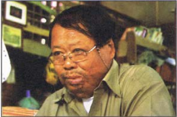
“ကျွန်တော်ဖြစ်စေချင်တာက အနာကြီးရောဂါသည် မိသားစုဝင်တွေ ချောင်ထဲ အမှောင်ထဲက ထွက်ခဲ့ပါ။ ထိုးဖောက်ပါ။ ဘာမျှမစိုးရွံ့ပါနဲ့။ ဘယ်သူကမျှ ခွဲခြားမှု မရှိပါဘူး”